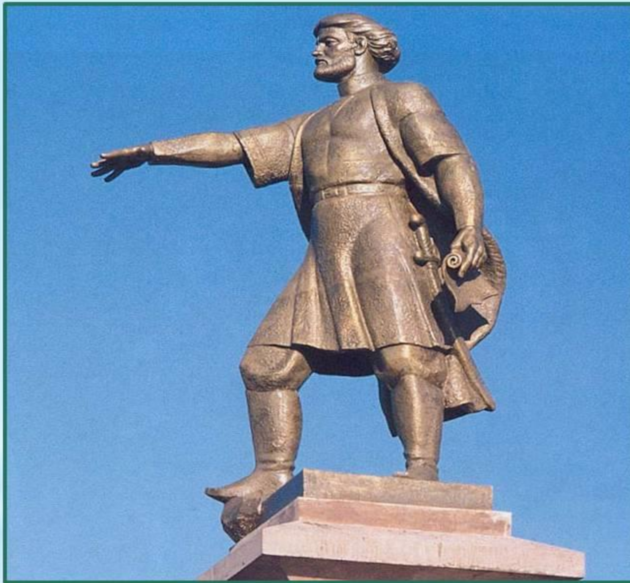
Памятник основателю Красноярска Андрею Дубенскому