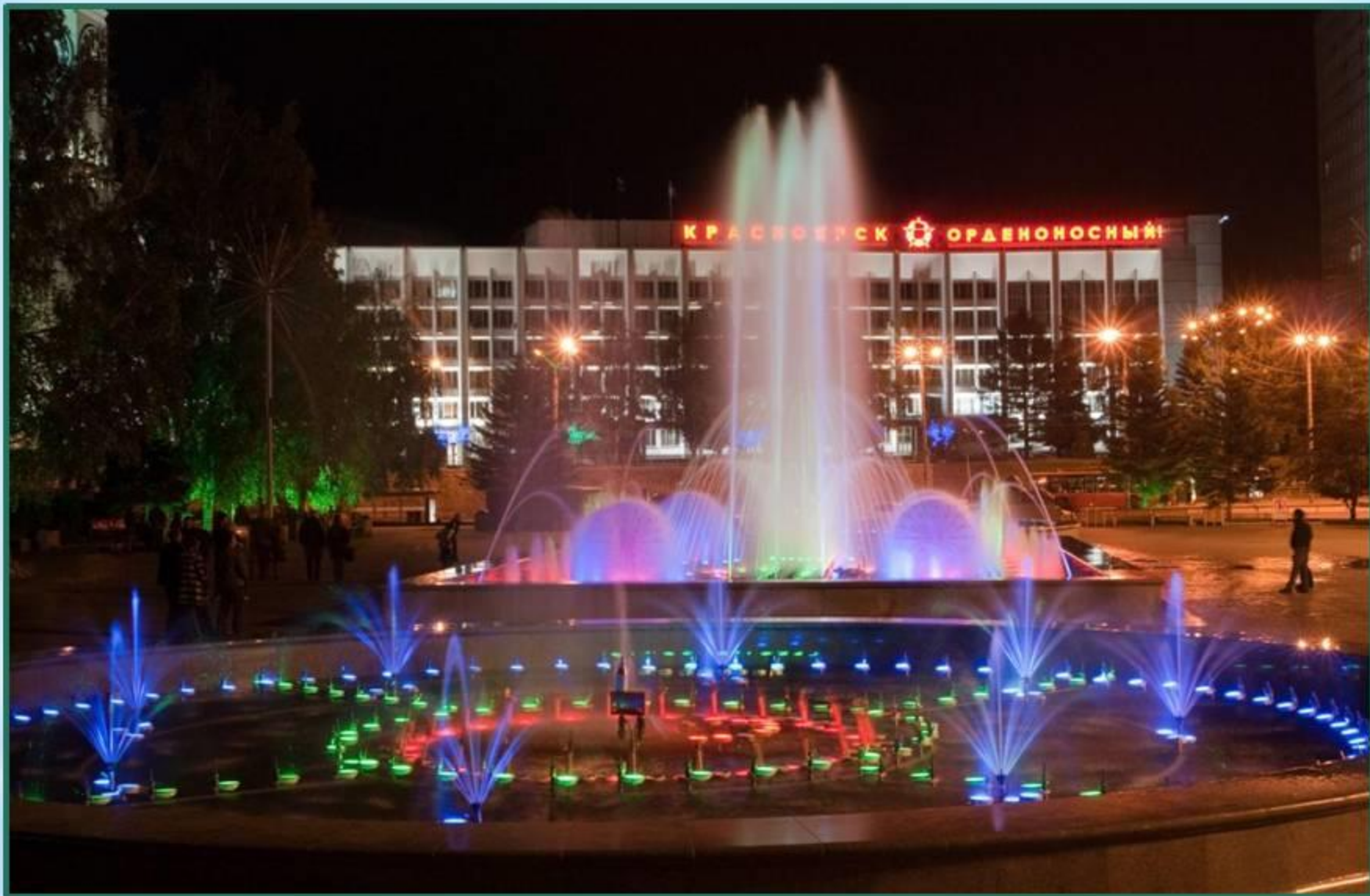
Светомузыкальный фонтан перед театром оперы и балета