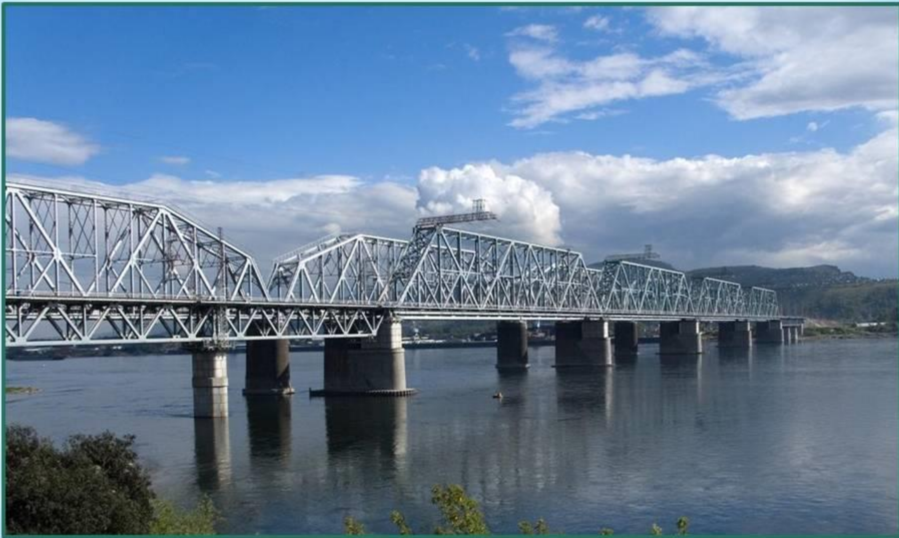
Железнодорожный мост через реку Енисей