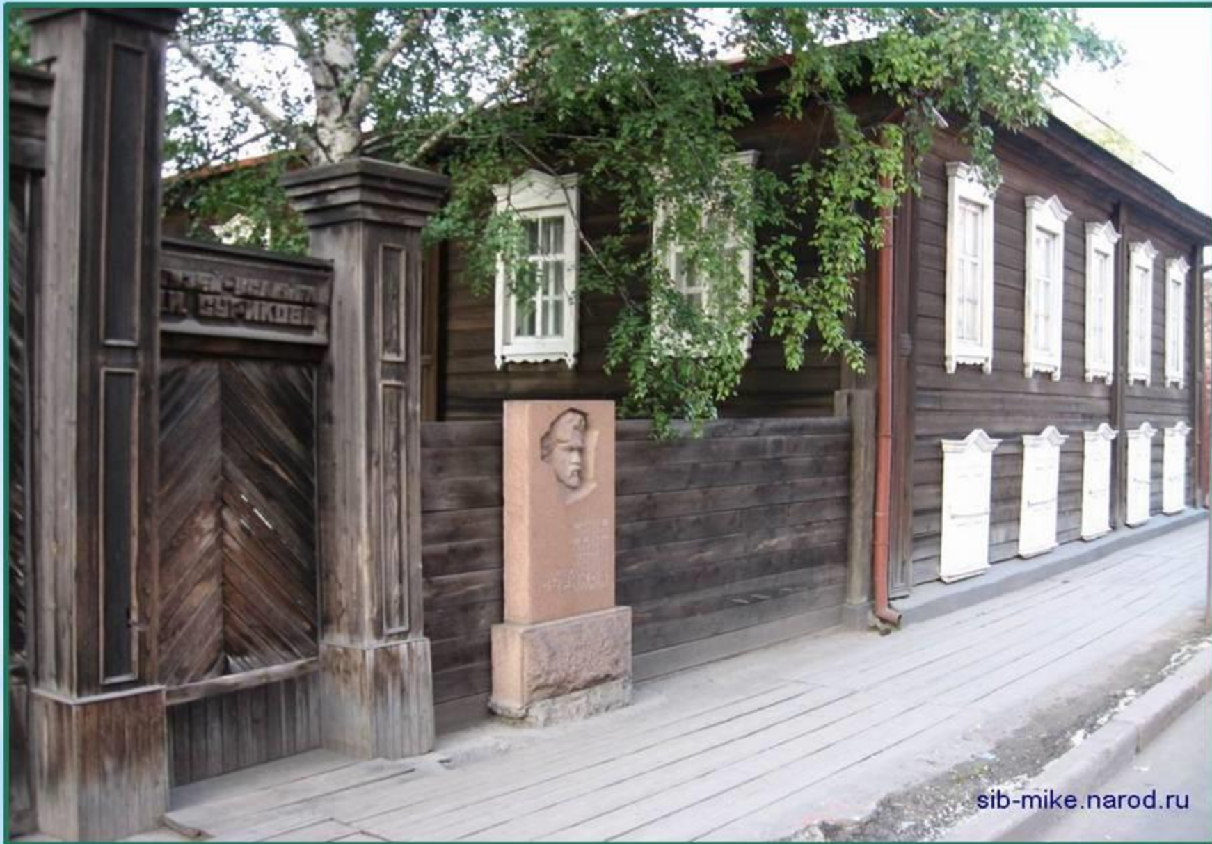
Музей-усадьба им. В.И. Сурикова