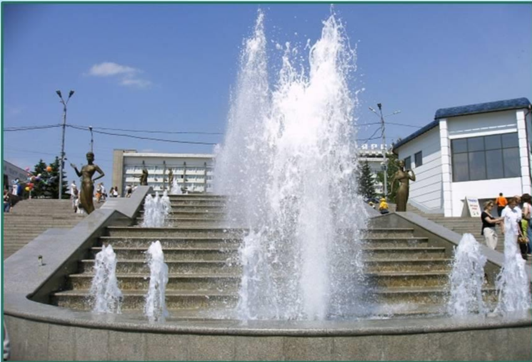
Каскад фонтанов «Реки Сибири»