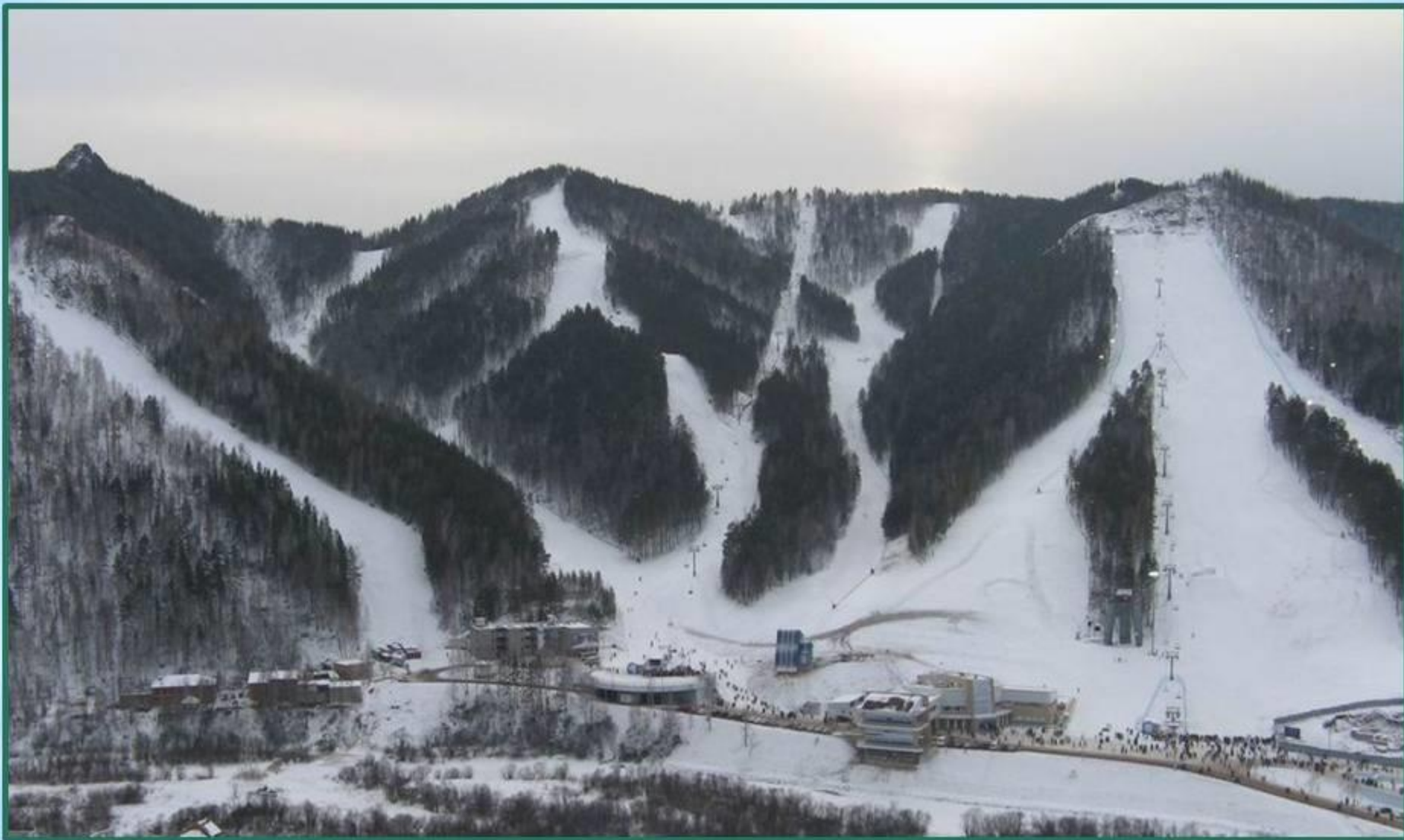
База отдыха «Бобровый лог»