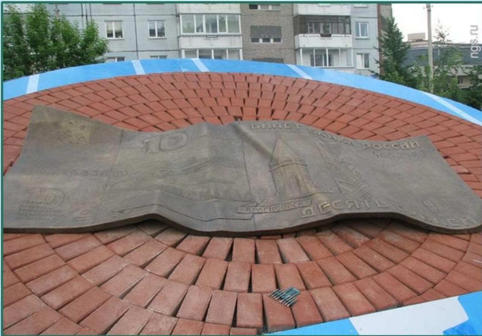
Памятник десятирублевой купюре