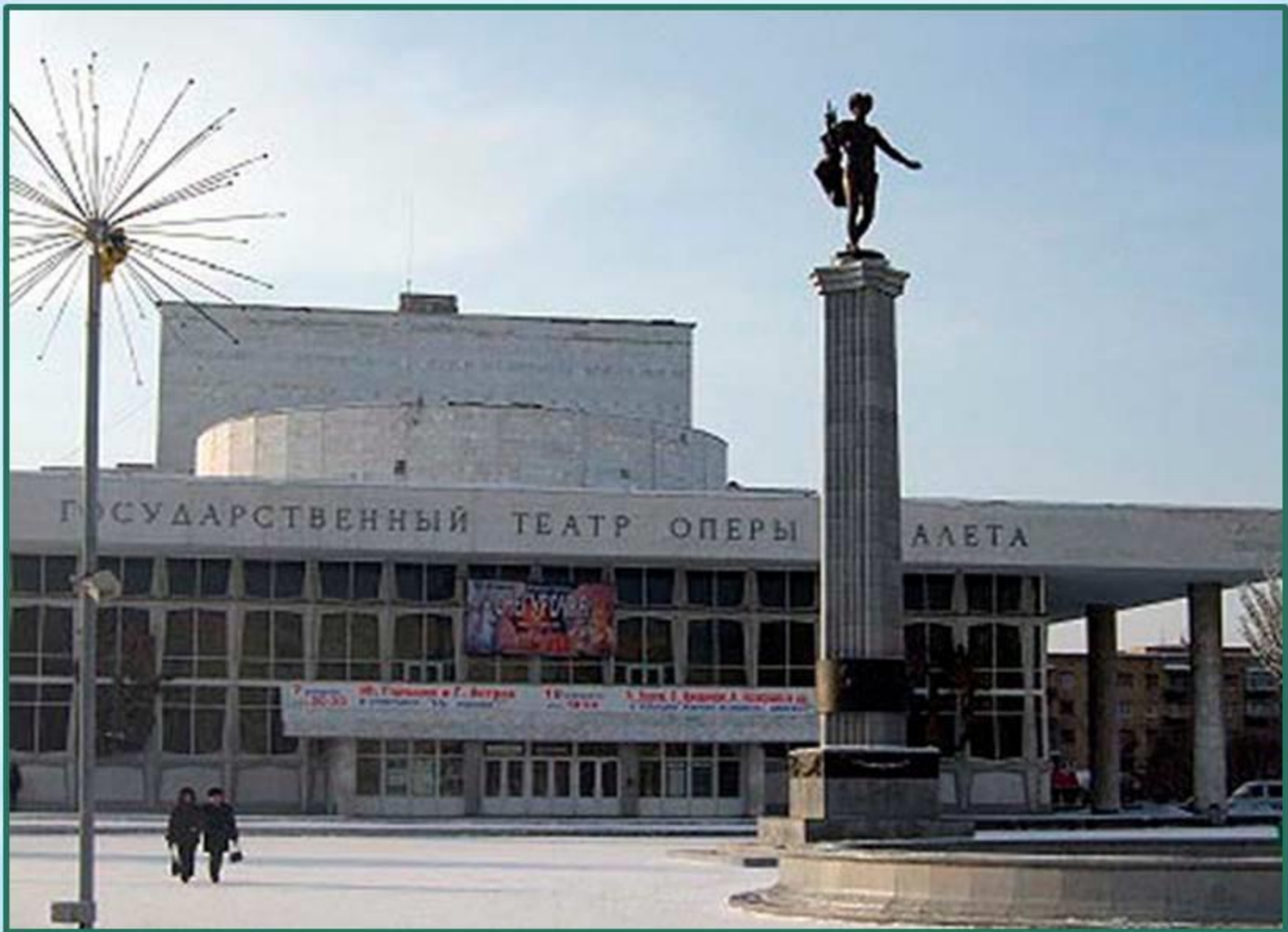
Красноярский государственный театр оперы и балета