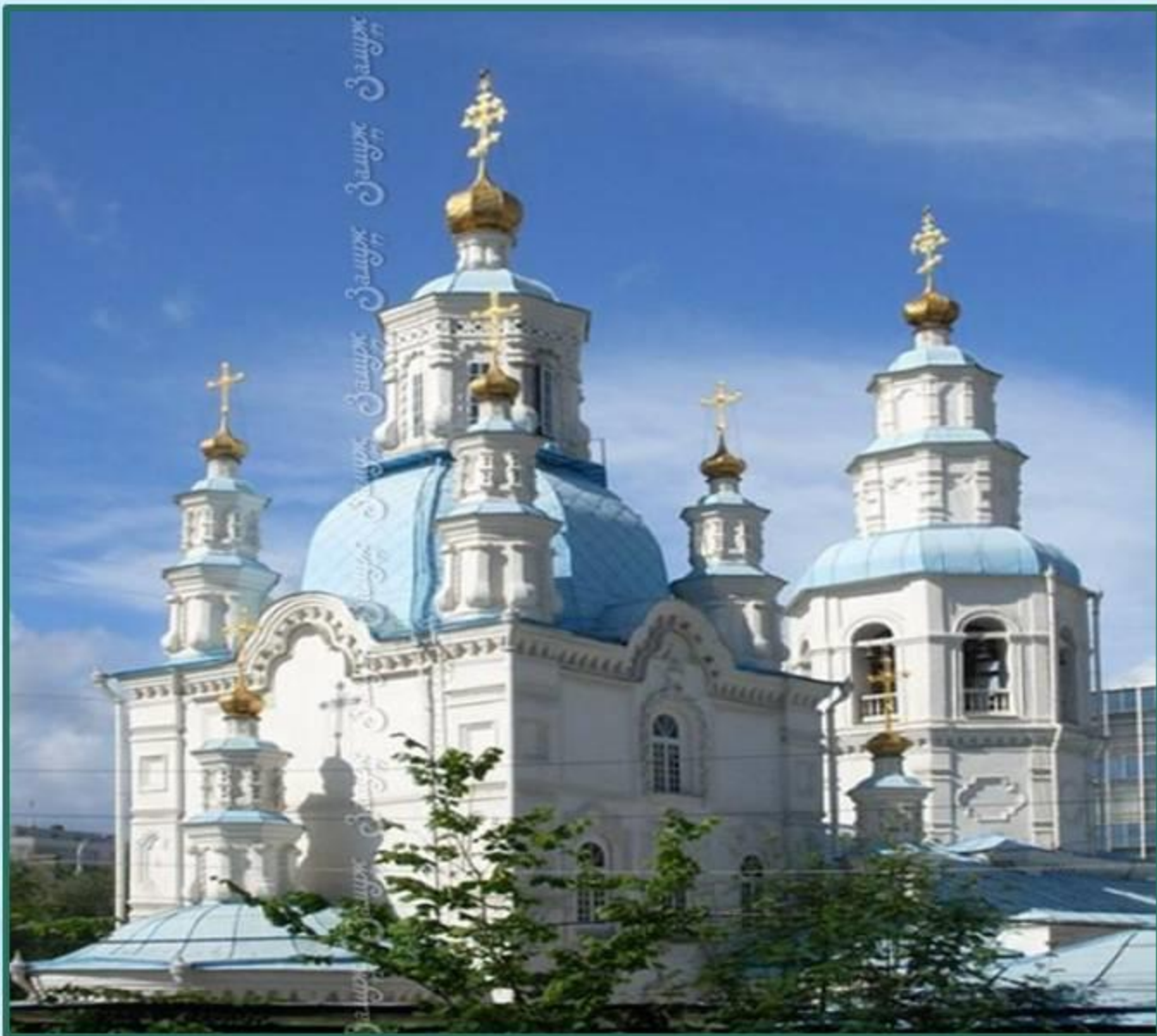
Покровский кафедральный собор