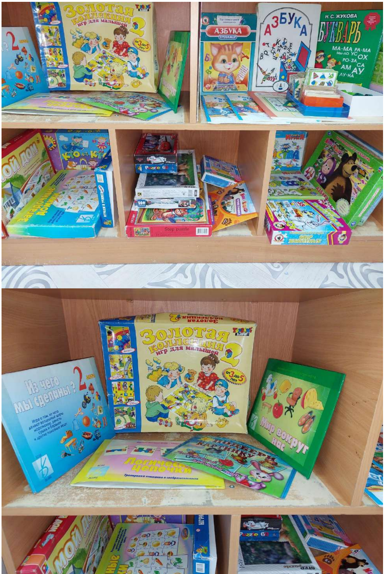
Центр «Школа»: различные прописи, тренажеры, азбука, букварь, лото, магнитные буквы, цифры, карточки для чтения по слогам, указка, магнитная доска. Дидактические игры «Азбука – тренажер», «Собери слово».